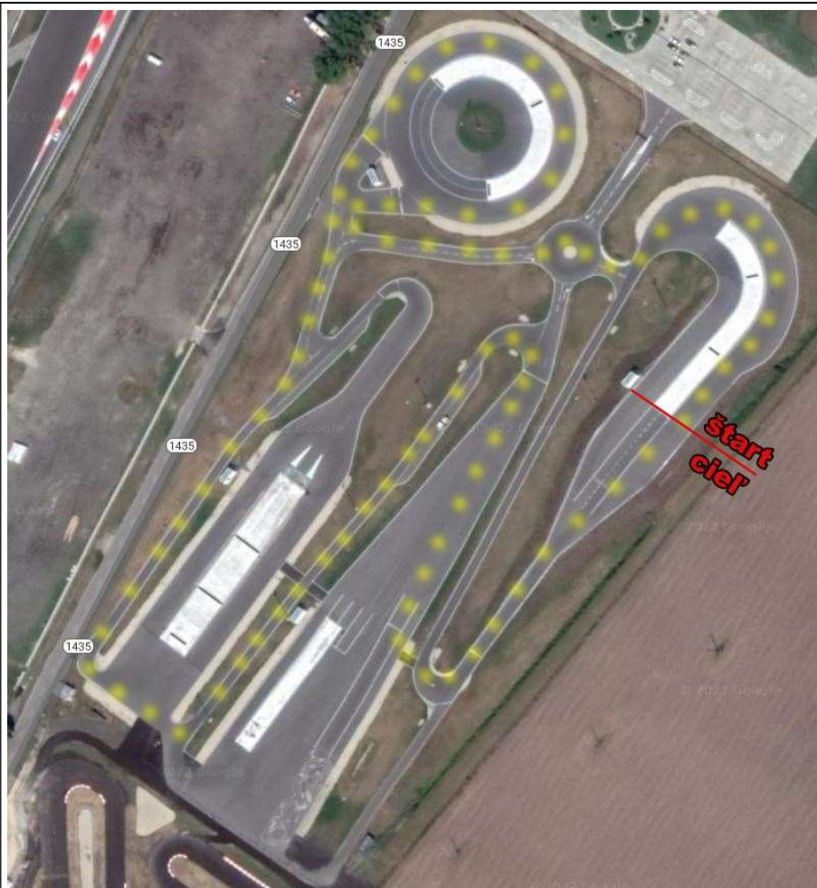
Obr.2: vytýčená trasa pretekov