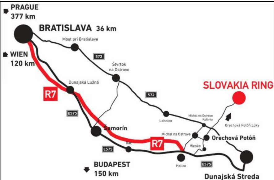
Obr.1: plán prístupu

Sociálne zariadenie pre pretekárov je v priestoroch budovy SLOVAKIA RING Parkovanie: