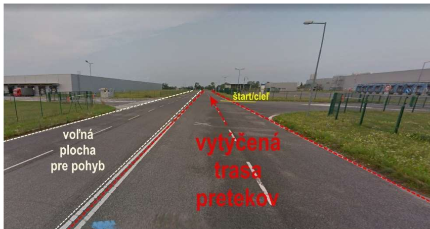
Obr.2: vytýčenie trasy v mieste cieľovej rovinky

Ľavý dvoj-pruh/ostane voľný pre pohyb divákov, odstavenie automobilov hasičov a sanitky, umiestnenie prenosných WC a mobilných odpadkových košov (obr. 2).