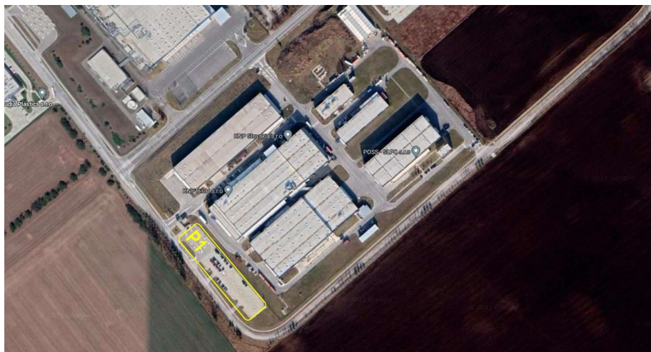
Obr.3: odstavná plocha pre automobily P1

Sociálne zariadenie pre pretekárov bude v priestoroch kancelárie pretekov do 9h30, Potom už len v blízkosti miesta štartu/cieľa budú umiestnené mobilné WC .