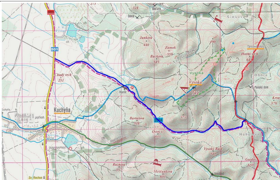
obr.1: 2D mapa trasy pretekov