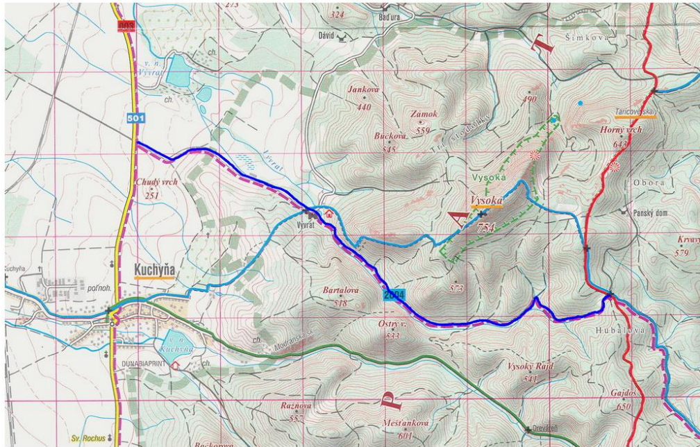
obr.1: 2D mapa trasy pretekov