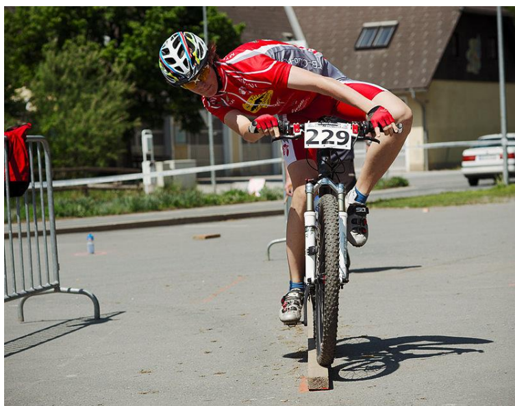
Obrázok 8. Jazda po doskách rôznych širok a výšok

Na druhej aj tretej prekážke tretej technickej sekcie môže pretekár/pretekárka získať 1 trestný bod (maximálne 2 trestné body).