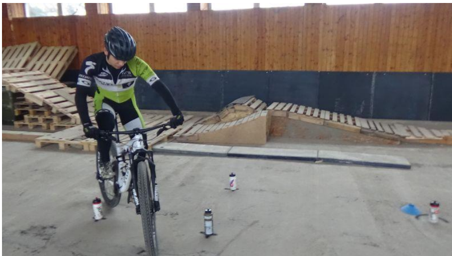
Obrázok 1. Obchádzanie 0,75 litrových cyklistických fľaši