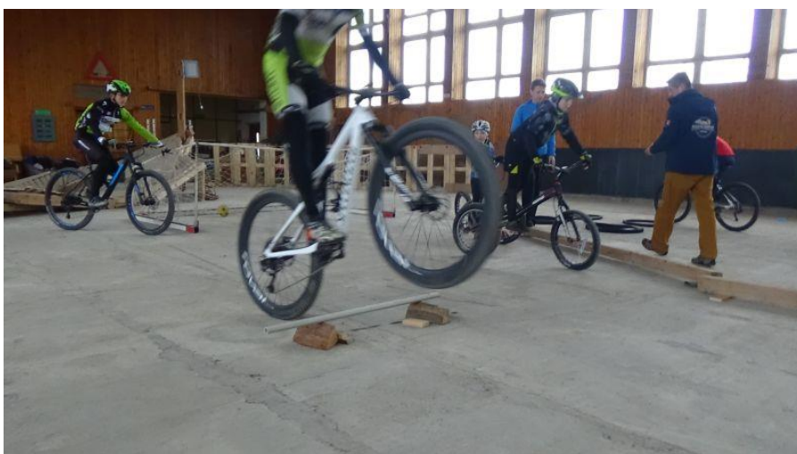
Obrázok 5. Preskakovanie prekážky technikou „bunny hop“

Za zhodenie žrde alebo realizáciu prejazdu nesprávnou technikou sa pretekárovi/pretekárke udeľuje trestný bod (na tejto prekážke je možné získať maximálne 1 trestný bod).