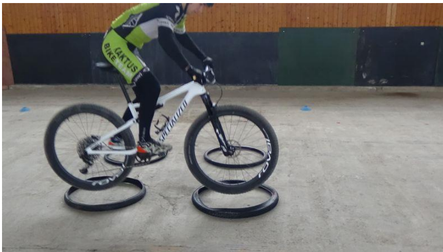
Obrázok 4. Preskakovanie okrajov pneumatík