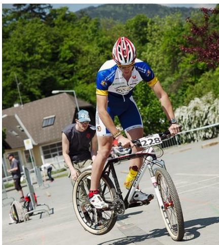
Obrázok 2. „Odhadzovanie“ kolies bicykla do strán

Za každý kontakt kolesa bicykla s pásom sa pretekárovi udeľuje trestný bod (na tejto prekážke je možné získať maximálne 2 trestné body – za kontakt s pásom predným aj zadným kolesom).