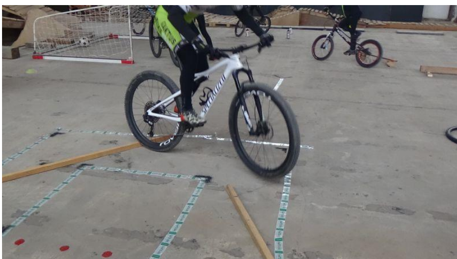
Obrázok 7. Prekážková jazda vo vyznačenom priestore